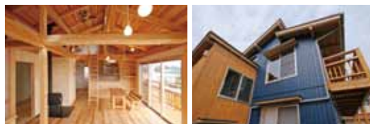
琵琶湖の 見える家 (大津市)